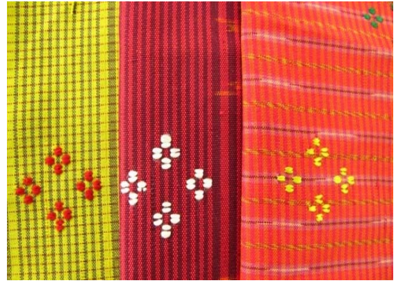
รูปที่ ๕ ตัวอย่างผ้ากาบบัวจกดาวแบบสมัยนิยม (ข้อ ๒.๕)