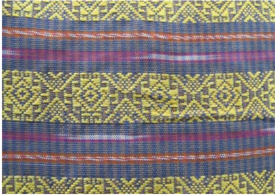
รูปที่ ๔ ตัวอย่างผ้ากาบบัวธรรมดาแบบสมัยนิยม (ข้อ ๒.๔)