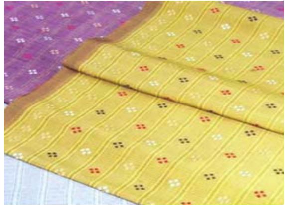
รูปที่ ๒ ตัวอย่างผ้ากาบบัวจกดาวแบบดั้งเดิม (ข้อ ๒.๒)