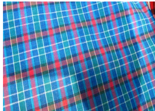
ผ้าลายตาหมากรุกหรือตาสีเหลี่ยม