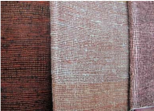
ผ้าลายขัดแบบลูกฟูก