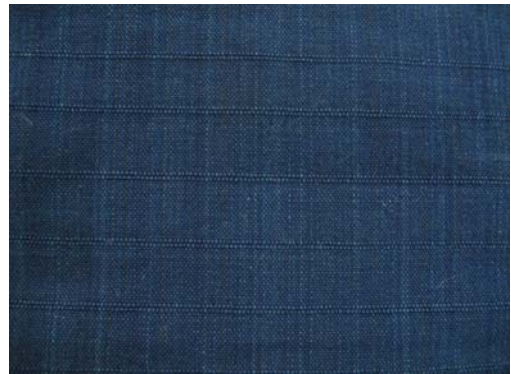
ผ้าลายคันทนา