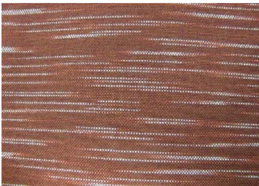
ผ้าลายสายรุ้งหรือสายฝน