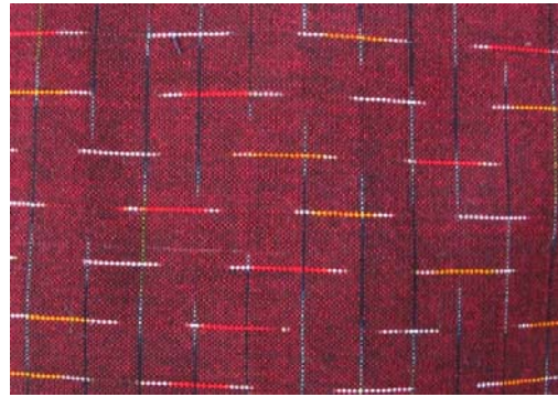
ผ้าลายสายรุ้งหรือสายฝน