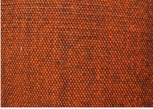
ผ้าลายขัดธรรมดา